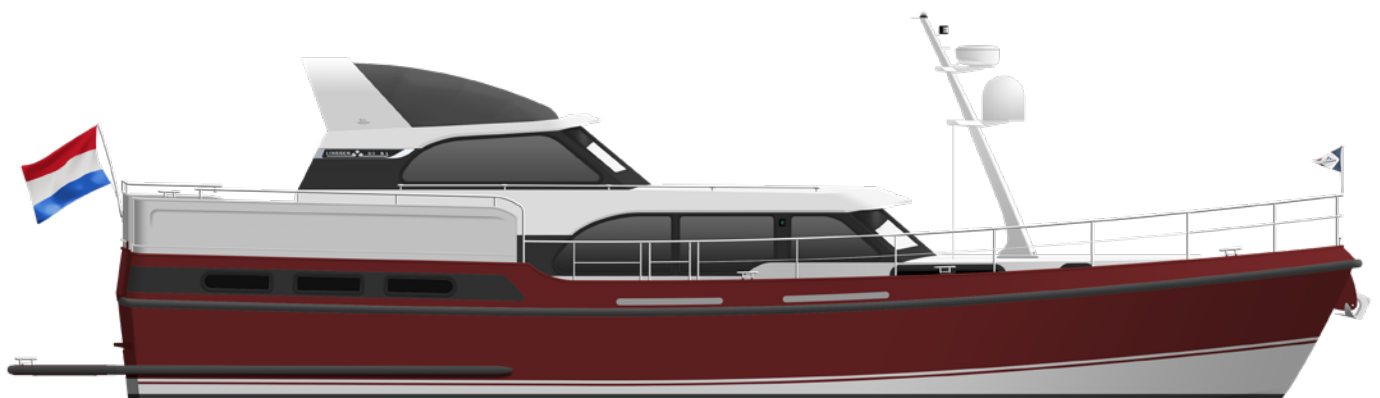
Artists Impression Linssen 50 SL AC Variotop®75 Edition