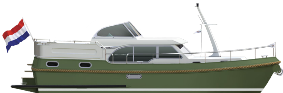
Artists Impression Grand Sturdy 35.0 AC 75 Edition