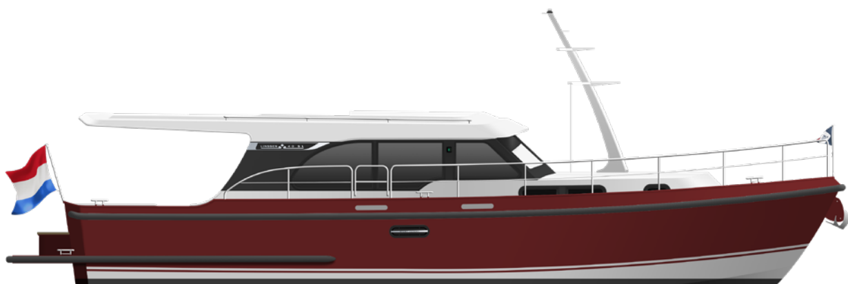
Artists Impression Linssen 40 SL Sedan 75 Edition